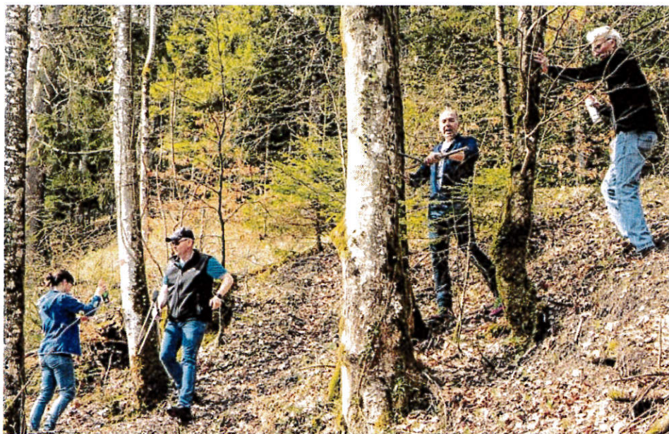
Deux cuves de 400 m 3 alimenteront le réseau de l'Association intercommunale du vallon de la Baumine. JORGE FERNANDEZ

La mise à l'enquête de ce réservoir de 800 m 3 – deux cuves de 400 m 3 alimenteront le réseau de l'Association intercommunale du vallon de la Baumine (AIVB) – est sous toit et les